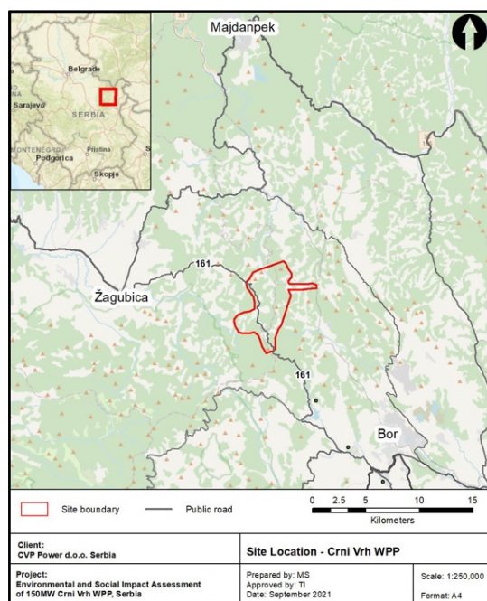
Slika 1 – Šira projektna lokacija